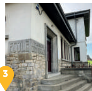
3 Une ancienne école