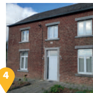
4 L'ancienne bibliothèque