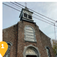
1 L'église Saint Feuillen