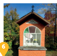
6 La chapelle Saint Donat