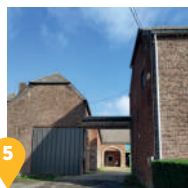
5 La ferme de Joncqouy