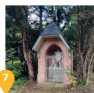
7 La chapelle du Sacré Cœur