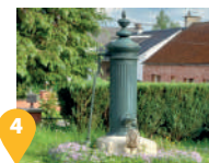
4 Une ancienne pompe à eau