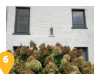
6 Une potale dédiée à Saint Donat et au petit Jésus de Prague