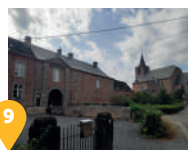
9 L'église Saint Martin et le château-ferme Ramet

* La Ferme de Narmont se situant fort à l'écart du village, si vous souhaitez vous y rendre, nous vous conseillons de reprendre votre voiture. Il s'agit d'une propriété privée, merci de respecter les lieux et de ne pas vous y aventurer.