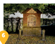
6 Le sentier Capelle et la chapelle Saint Hubert