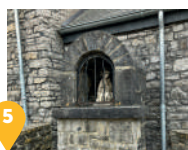
5 La potale Notre Dame des Champs