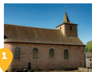
1 L'église Saint Martin et un monument aux morts