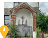
3 La chapelle du Calvaire