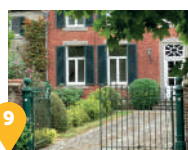
9 La Ferme du Vieux Tilleul