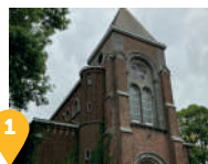
1 L'Eglise Saint Denis