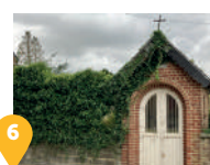
6 La chapelle du Sacré Cœur