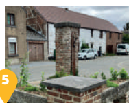
5 Une ancienne pompe à eau