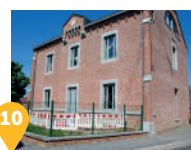
10 L'ancien presbytère