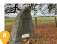
8 Un monument aux morts et la chapelle Notre Dame des Affligés