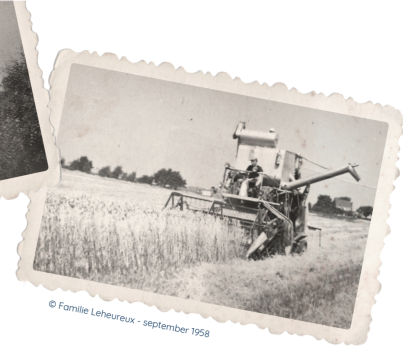
© Famille Leheureux - september 1958